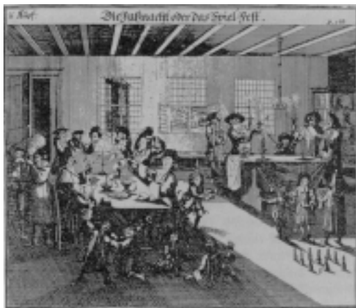
Spielende Erwachsene und Kinder bei einer Purim-Feier, Nürnberg 1734.

nern und Frauen in der Öffentlichkeit und auf Festveranstaltungen. Früher, in Ägyptenland, da seien die jüdischen Frauen noch keusch gewesen, behauptet Altschul in einer für Sittenprediger typischen Idealisierung der Vergangenheit. Heute aber gehe es weniger sittsam zu, so dass nicht einmal die ältere Generation seiner Zeit seine Morallehren unterstützen mag: „un’ di alten weren [= verhindern] es nit. un wenn man di alten an ret drum do sprechen si es is ain jugent kan im nit ain alten kopf auf setzen.“ 5