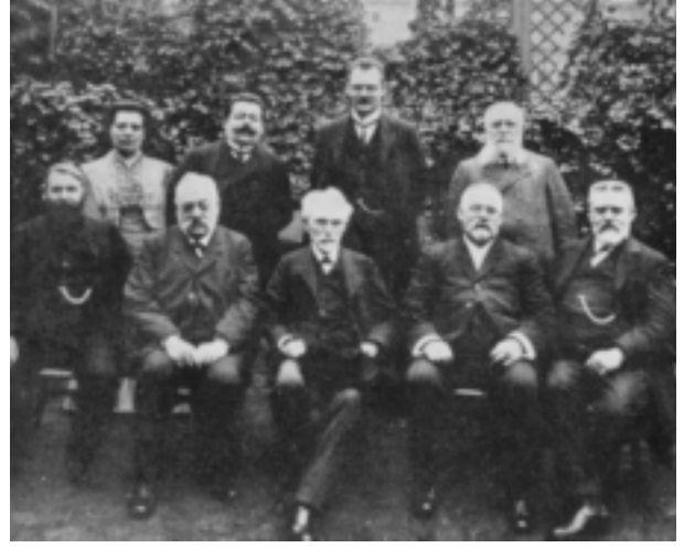
Der Vorstand der Sozialdemokratischen Partei Deutschlands 1909. In der vorderen Reihe als zweiter von links Paul Singer, rechts neben ihm August Bebel.

des Antisemitismus und für die Vollendung der Emanzipation der Juden in der deutschen Gesellschaft vermutlich weit mehr als alle politischen Diskussionen und Schulungen.“ 9