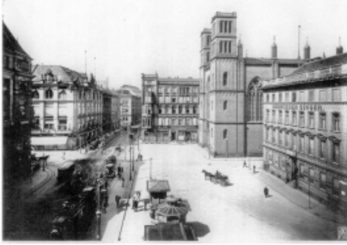
Das Geschäftshaus der Damenmätelfabrik Gebrüder Singer am Werderschen Markt in Berlin 1904