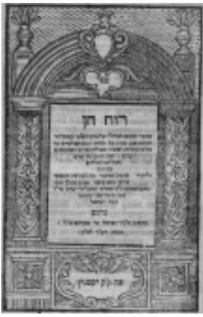
Ruach chen – traditionell Jehuda ibn Tibbon zugeschrieben – führt in die philosophische Terminologie ein. Die Jessnitzer Ausgabe von 1744 enthält einen Kommentar des Israel Zamosc. Sie erschien im einflussreichen Druckhaus des Israel b. Abraham aus Amsterdam. (Haskala-Bibliothek, Steinheim-Institut)

dische Tradition' anzeigen, wurden anhand enzyklopädischer Projekte, jiddischer Übersetzungen sefardischer Poesie oder der ‚gefälschten‘ Responsensammlung Besamim Rosch des Saul Berlin diskutiert. Nicht zuletzt ging es um Fragen der Überlieferung, etwa des Kusari (Adam Shear, Pittsburgh), und um eine „Sozialgeschichte des Lesens“